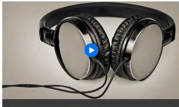
Bayern 2 – Via Silenzi

Ein Beitrag von: Lenz, Folkert Stand: 21.02.2026 | Bildnachweise