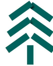
Wald und Holz