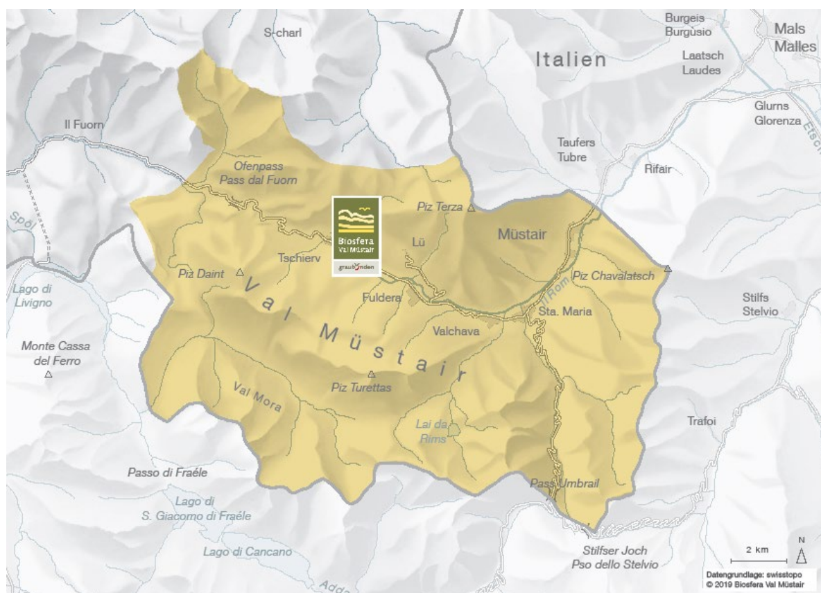
Illustraziun. 1. Perimeter dal Parc da natüra regional Biosfera Val Müstair.

Il Parc da natüra regional Biosfera Val Müstair cumpiglia cun 199 km 2 l'inter territori dal cumün da Val Müstair e s'extenda dal Pass dal Fuorn sur las fracziuns da Tschier, Lü, Fuldera, Valchava, Sta. Maria fin a Müstair al cunfin cul Vnuost vaschin (Tirol dal Süd / Italia, ill. 1). Il Parc da natüra es situà tanter il Parc Naziunal Svizzer i'l vest e'l Parc Naziunal dal Stelvio (Italia) vers süd. Cul Parc Naziunal Svizzer e parts dal cumün da Scuol fuorma il Parc da natüra ultra da quai il Reservat da biosfera Engiadina Val Müstair da l'UNESCO.